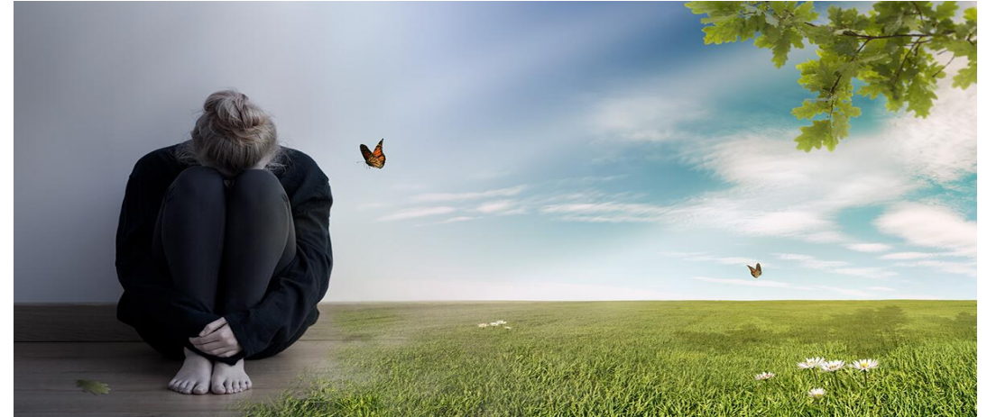
Ängslan, oro eller ångest Söderhamn