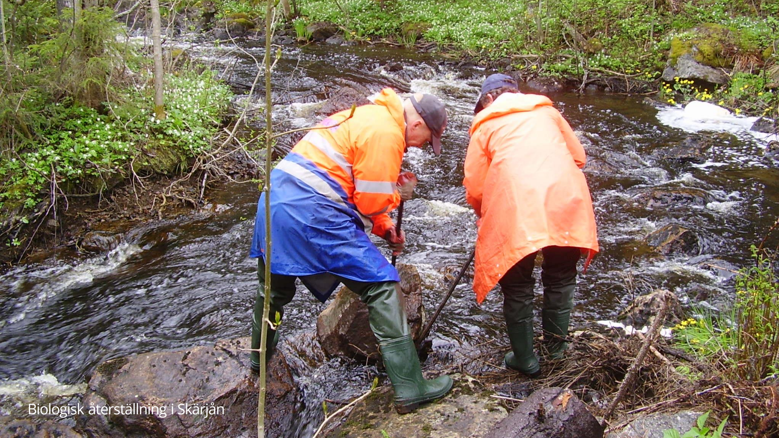
Biologisk återställning i Skärjån