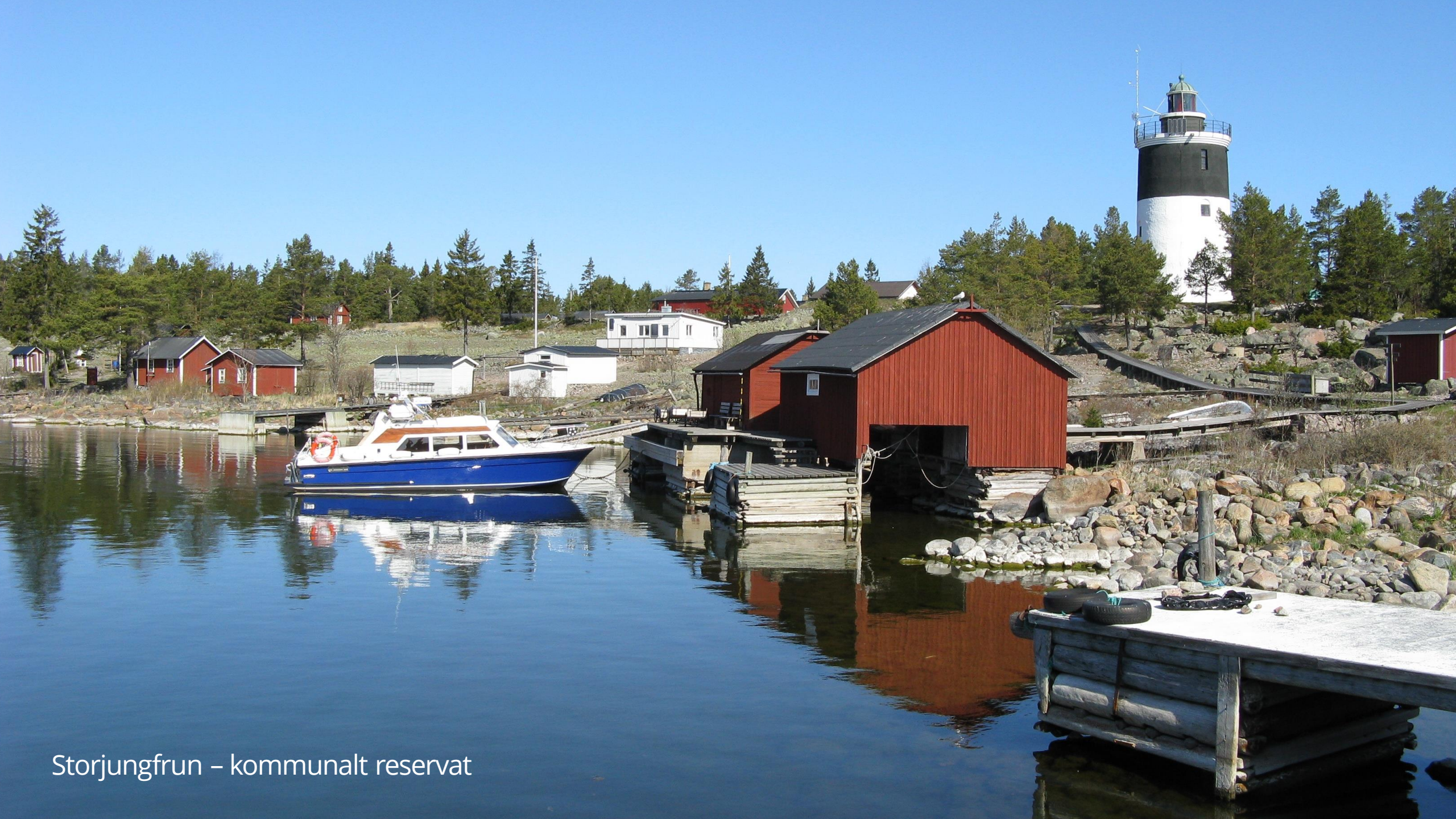
Storjungfrun – kommunalt reservat